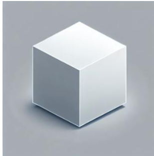
Figura 1 – Cubo indiviso

Rappresentazione simbolica dello Spazio come unità indivisa, priva di interno ed esterno.