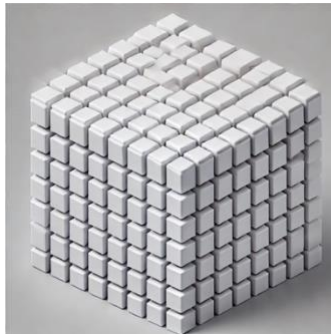
Figura 2 – Spazio tassellato

L'immagine non pretende di mostrare lo Spazio "com'è", ma di evocare l'idea della coerenza della Totalità.