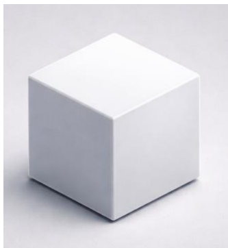
Figura 1 – Cubo indiviso.

Assumiamo lo Spazio–Totalità secondo uno schema cubico unitario: senza esterno reale e, quindi, senza un ‘dentro’ in senso proprio; esso nomina qui la totalità degli essenti 62 e, nel lessico adottato in questo capitolo, si lascia descrivere secondo la compresenza delle unità minime di coerenza (Mulaprakriti), senza introduzione di un altro referente.